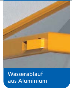
Wasserablauf aus Aluminium

In der linken Abbildung präsentiert sich das Modell Havel in der Sonderbeschichtung RAL 1023I verkehrsgelb und einer Sonderabdeckung in lichtgrau.